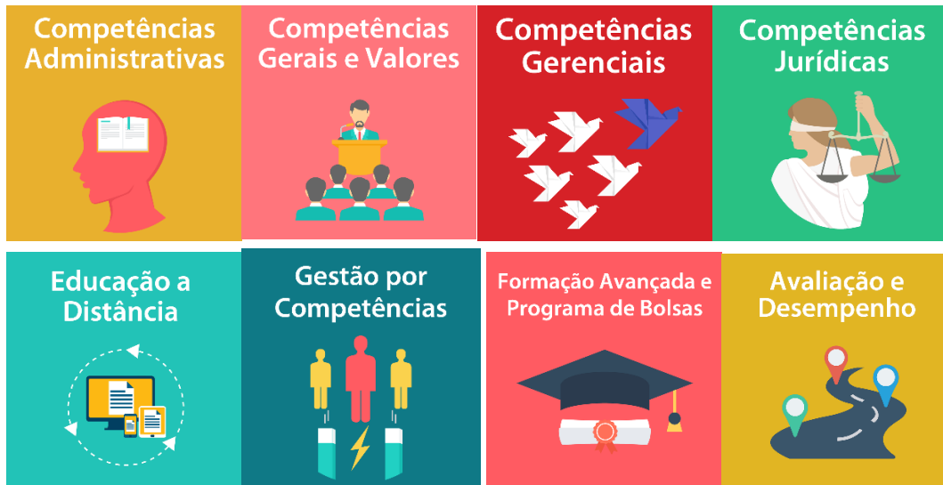
Figura 1: Áreas de atuação da ECORP