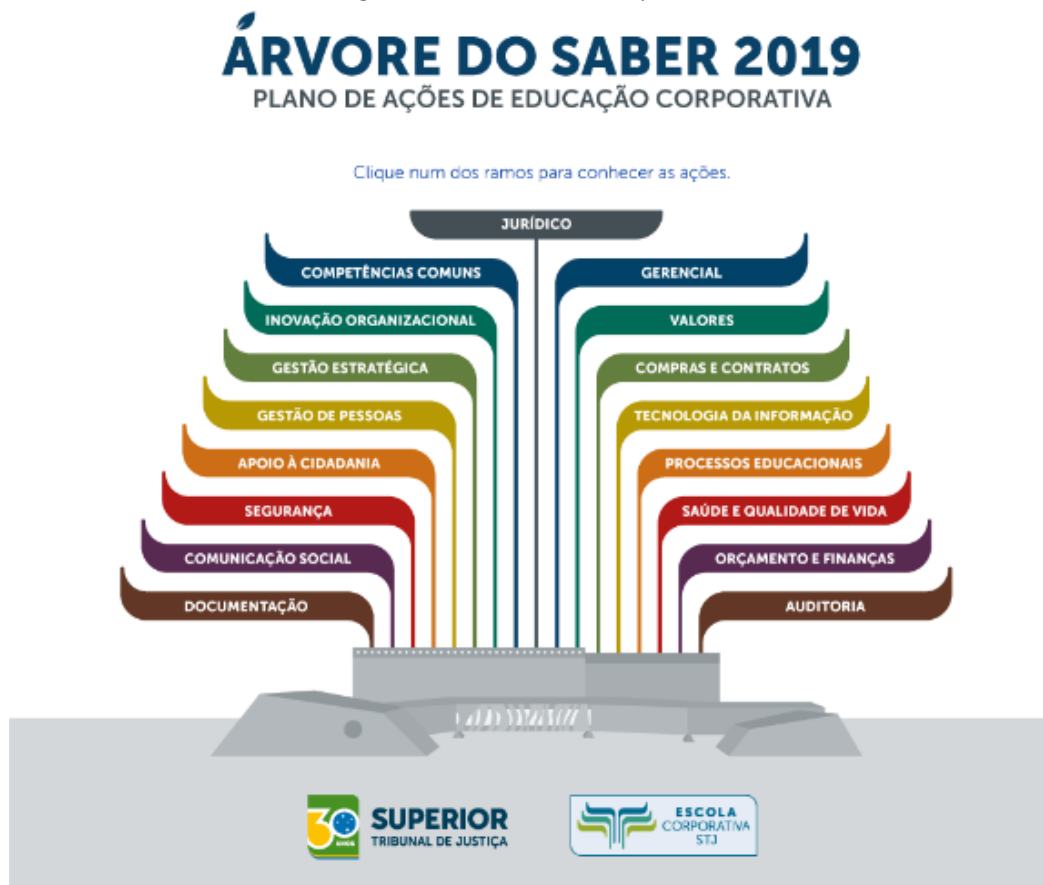
Figura 2 - Árvore do Saber Corporativo

A ECORP direciona suas ações de capacitação pela Árvore do Saber Corporativo , como pode ser visto na figura abaixo: