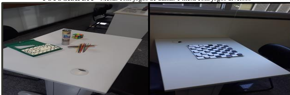
FOTOGRAFIA 3 - Mesas com jogos de damas e mesa com jogos diversos

As atividades lúdicas têm um papel importante para se desenvolver habilidades intelectuais, sociais e motoras. Segundo André Zatz e Sílvia Zatz (2017): “O lúdico é inato do ser humano. Quem não brinca ou não encontrou uma forma de brincar, seja um futebol, um jogo, um game, tem uma vida muito chata”. Na Fotografia 3, mostra-se as mesas com jogos disponibilizados, pega-varetas, dominó, cubo-mágico e damas.