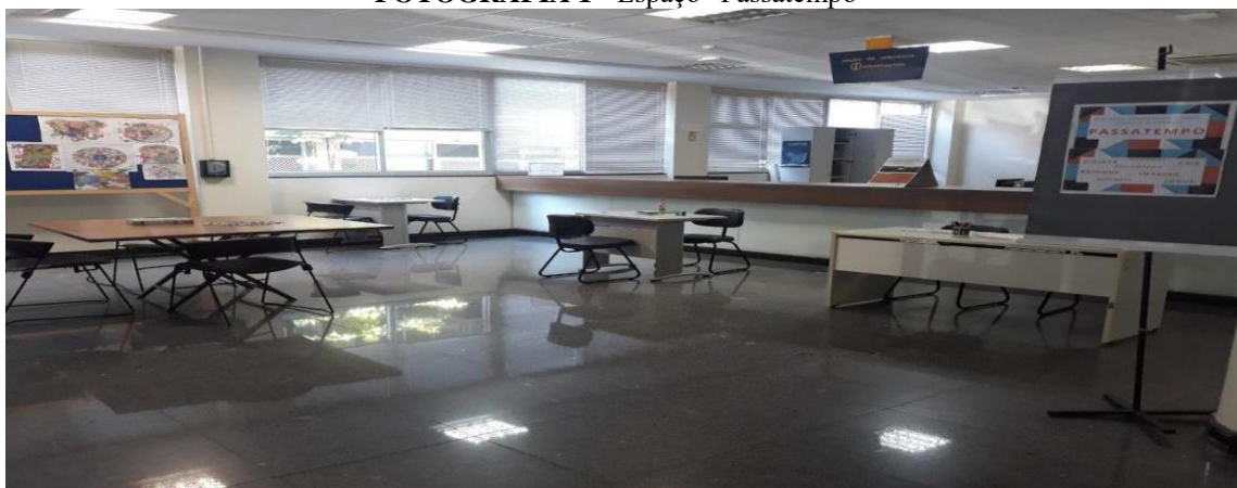
FOTOGRAFIA 1 - Espaço “Passatempo”

Divirta-se, memorize, crie, jogue, brinque, descanse, imagine, descontraia, são algumas das chamadas do banner do espaço. A fotografia 1, mostra o espaço criado, os jogos disponibilizados e o banner do projeto.